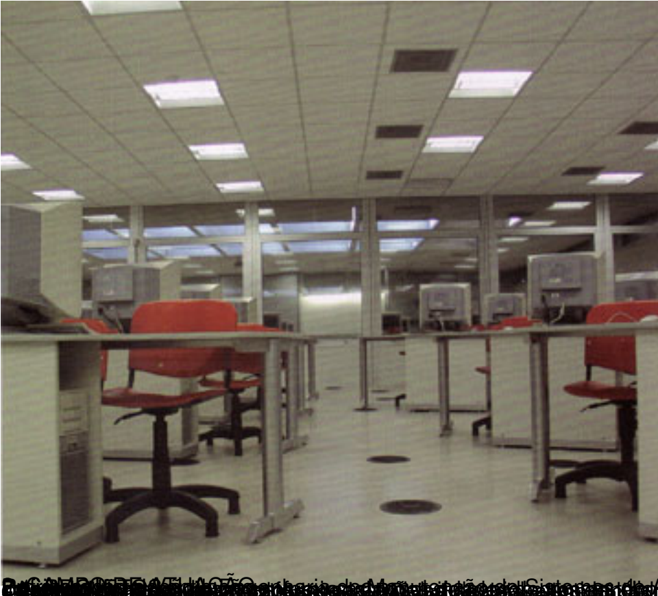
FIG. 10.55 - Vista do Ambiente de Atuação do Sistema de Ar Condicionado das Escolas do