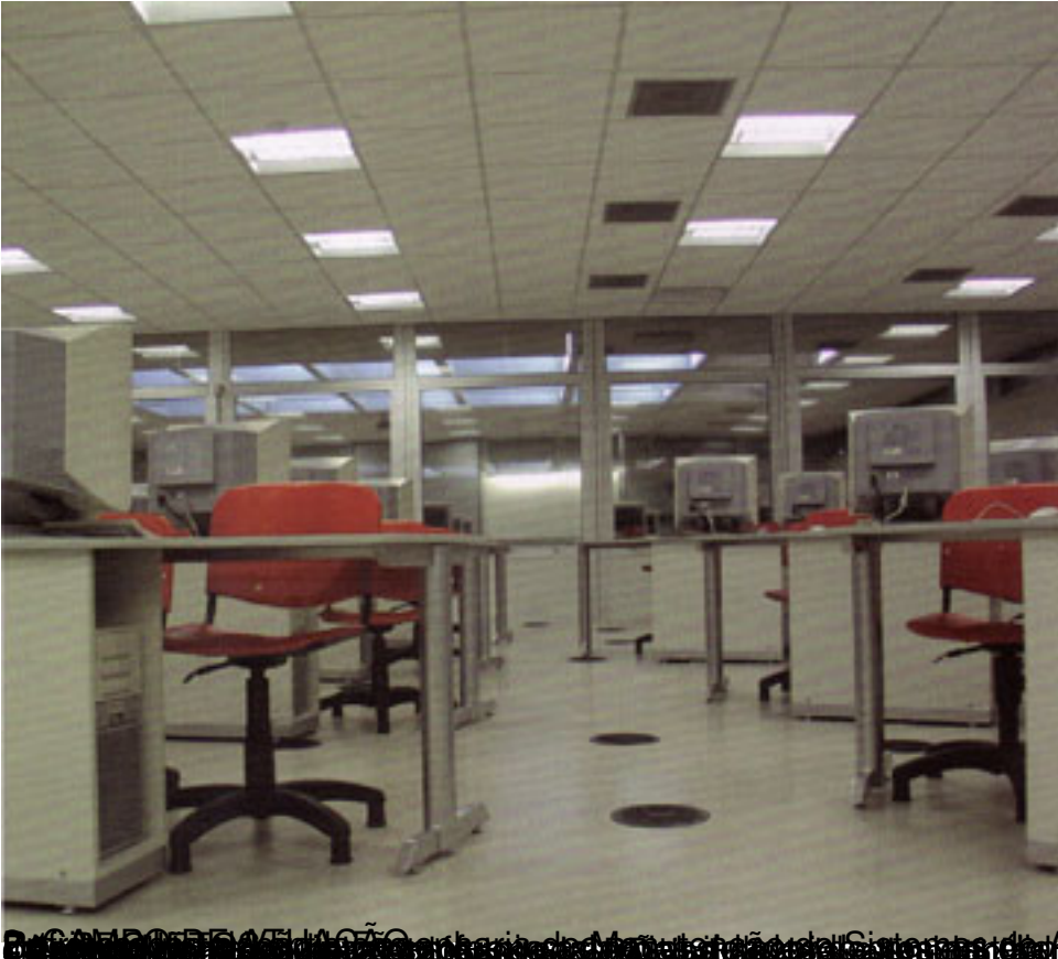
Fig. 10.10.5.1.45 - O sistema de Arrefecimento da Sala de Computadores do Colégio de Engenharia (Escalas)